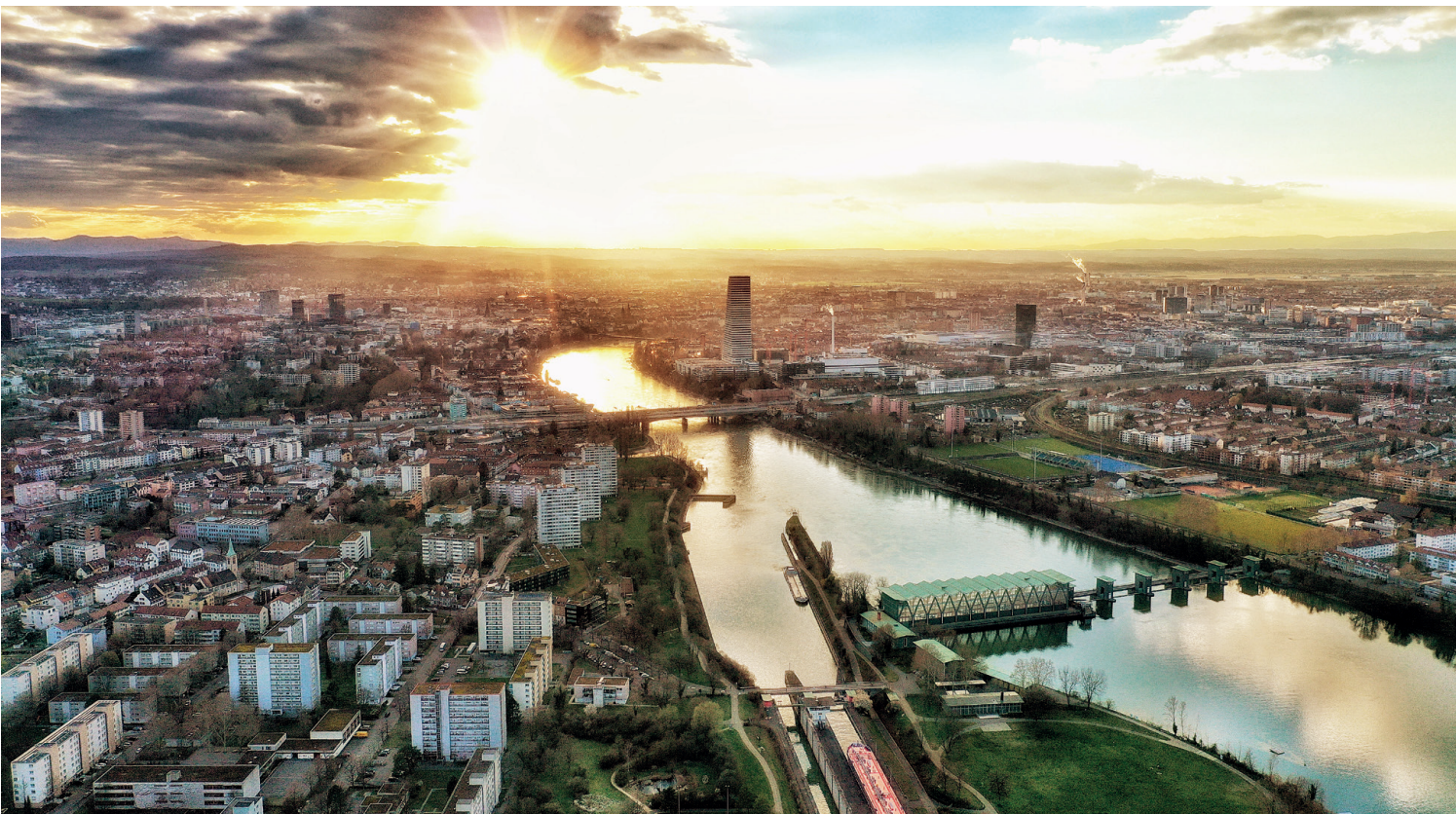
Blick auf Basel und die Schwarzwaldbrücke.

Der Verkehr hat in den letzten Jahren massiv zugenommen. Dies führt zu höheren Belastungen und damit zu grösseren Abnutzungen der Infrastrukturen. Aber auch aus Altersgründen müssen viele Bauwerke umfassend erneuert werden, nicht zuletzt wegen der Belastung durch Witterungseinflüsse, dem Einsatz von Streusalz und Temperaturschwankungen im Jahresverlauf. Die Unterhaltsarbeiten sind unvermeidlich, um die Verkehrssicherheit zu gewährleisten. Sie werden zu dem Zeitpunkt ausgeführt, wo das Verhältnis von Kosten und Nutzen am besten ist. Wird zu früh saniert, wird Nutzungsdauer verschenkt. Bei zu späten Eingriffen besteht die Gefahr von übermässig grossen Schäden und entsprechend höheren Kosten.