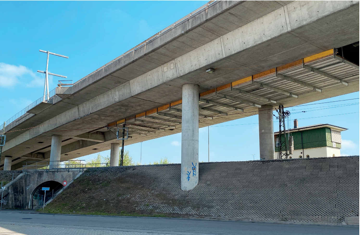
Die Grenzbrücke verbindet Basel mit Weil am Rhein.

Seit November 2020 läuft die zweite von fünf Bauphasen auf der Grenzbrücke. Die geplanten Arbeiten dieser Phase dauern bis voraussichtlich Oktober 2021. Der Schwerpunkt der Tätigkeiten liegt in Fahrtrichtung Schweiz.