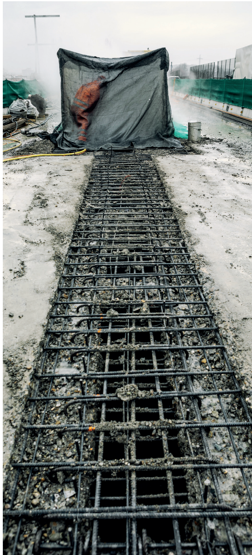
Freigelegte Bewehrungseisen nach den Hydrojetarbeiten.

5 Bauphase 5 Ersatz Entwässerungsrinne aufgrund von Nutzungsänderungen